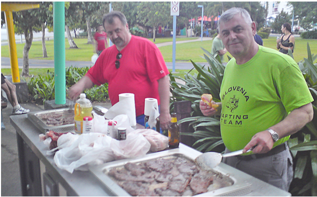
Tako pocenimo strokovne ekskurzije - utrinek iz Avstralije