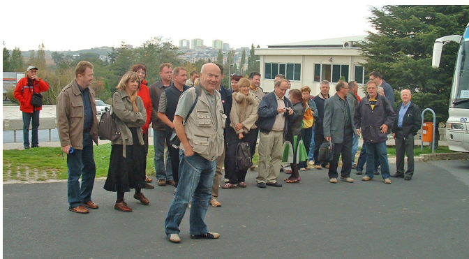
Pred tovarno gospodinjne opreme BSH v Cerkezoy - Turčija

Na nivoju Slovenije je DSIT NM povezano z Zvezo strojnih inženirjev Slovenije, dobro pa je tudi sodelovanje z nekaterimi drugimi društvi in sekcijami.