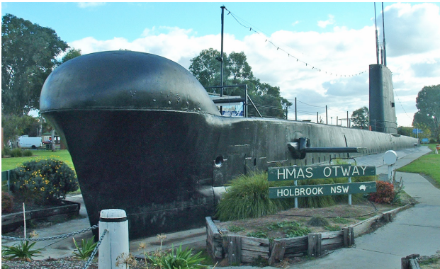
Podmornica v Holbrooku, NSW, sredi celine - Avstralija